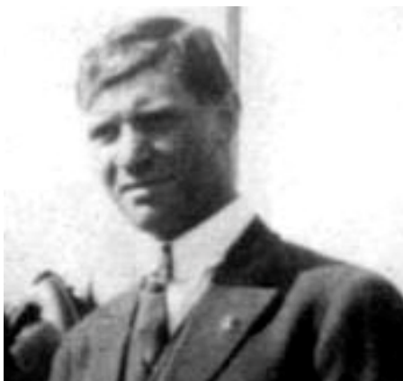
Ο Λούι Τίκας

Στην Αμερική τον τιμούν σαν ήρωα από τις αρχές του περασμένου αιώνα. Στο Ρέθυμνο τη γενέτειρα του αργήσαμε πολύ να τον γνωρίσουμε. Ο Γιώργος Σταυρουλάκης, που αργότερα έγραψε και βιβλίο σχετικό με τον μεγάλο συνδικαλιστή Λούις Τίκας ήταν ο πρώτος που μας τον γνώρισε στη δεκαετία του 90.