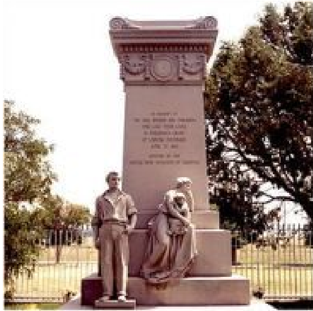
Το μνημείο προς τιμή των ανθρακωρύχων

Ο Τίκας αποφάσισε να οργανώσει όσο γίνεται καλύτερα το συνδικαλιστικό τους κίνημα έχοντας τη συμπαράσταση ενός μεγάλου μέρους των Ελλήνων εργατών του Κολοράντο. Άρχισε να περιοδεύει με δικά του έξοδα, στις ανθρακοφόρες περιοχές της βόρειας και νότιας περιφέρειας του Κολοράντο στενά συνδεδεμένος με την Ένωση Ανθρακωρύχων Αμερικής την οποία και ενημέρωνε για την επιτόπια ερευνά του. Έτσι κατάφερε να αποκτήσει την εμπιστοσύνη των εργαζομένων και να εξελιχθεί σε ηγετική μορφή. Ήταν για όλους ο «Λούης ο Έλληνας» ή ο «Λίο ο Κρητικός», όπως τον αποκαλούσαν. Έγινε θρύλος.